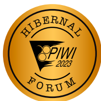
GOLD PIWI 2023