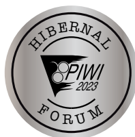
SILVER PIWI 2023

Vína, která získala titul Šampion PIWI, Gold PIWI a Silver PIWI mohou být v souladu se statutem výstavy označena výše uvedenými medailemi. Objednávku medailí pošlete prosím výhradně emailem na: piwi-sardice@seznam.cz , v termínu do 7.6.2023 . Cena medaile 2,50 Kč.