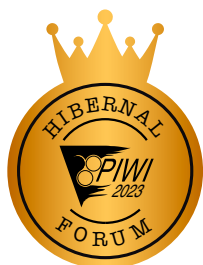
CHAMPION PIWI 2023